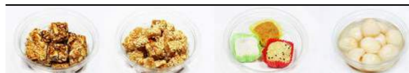
D1. Nougats durs