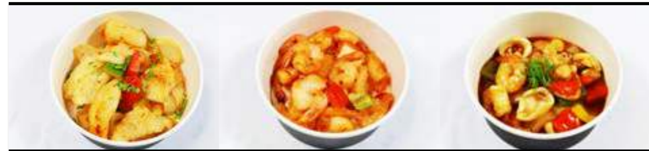
P9. Poisson sel poivre