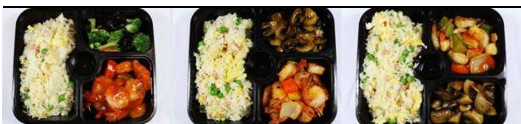
Mc9. Crevettes sauce piquante