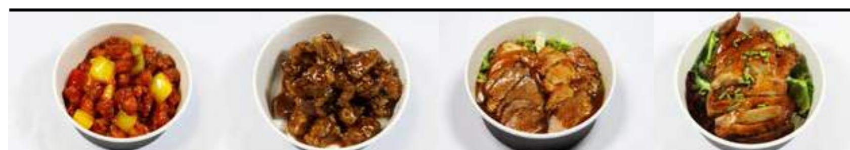
P5. Poulet aigre douce