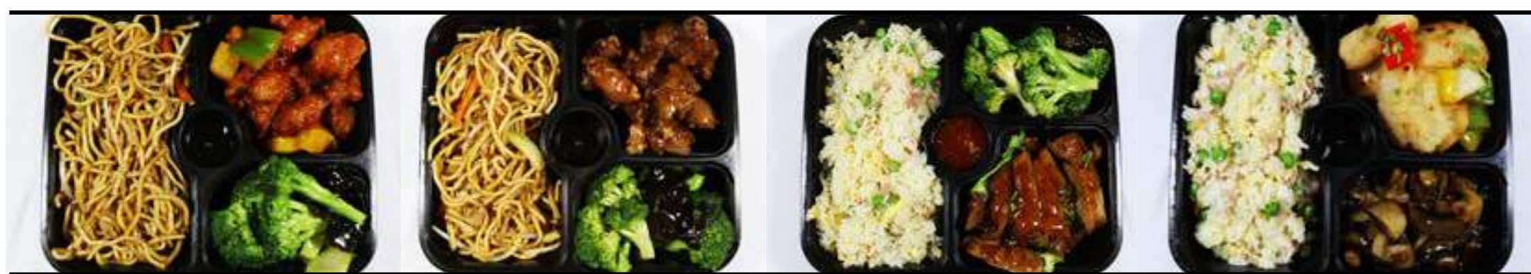
Mc5. Poulet aigre douce