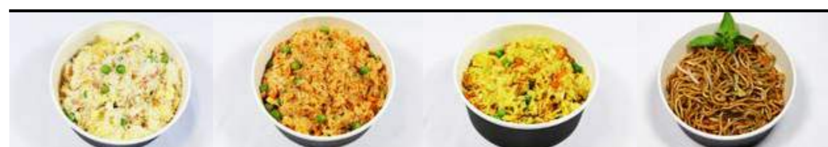
P15. Riz cantonais 4€