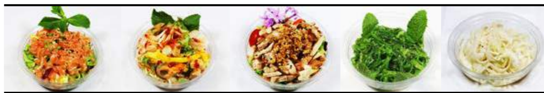
E1. Salade de saumon