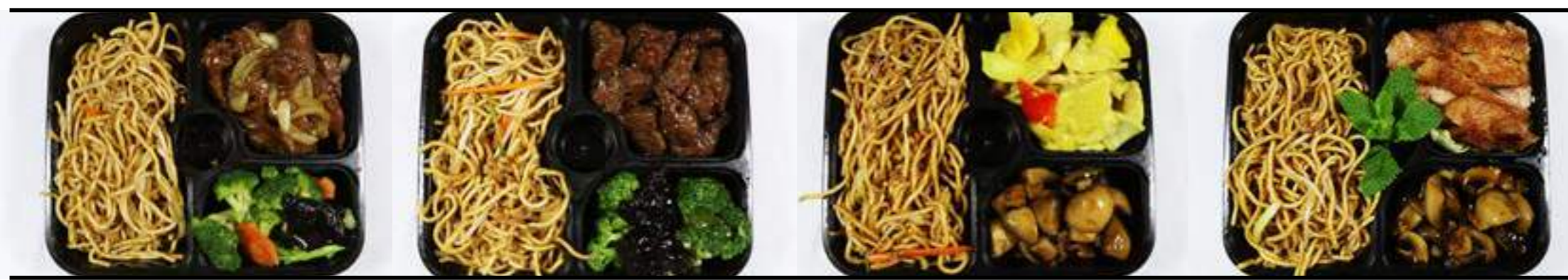
Mc1. Bœuf oignons