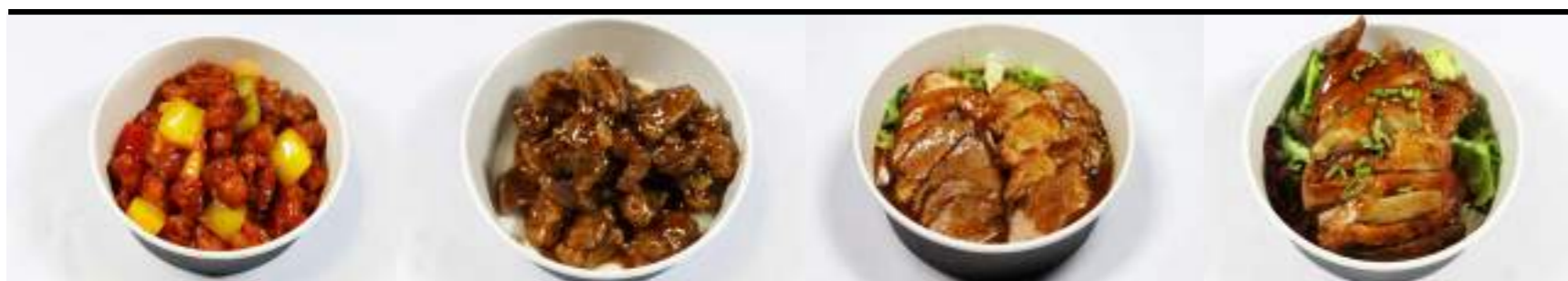
P5. Poulet aigre douce P6. Porc au caramel P7. Porc laqué P8. Canard laqué