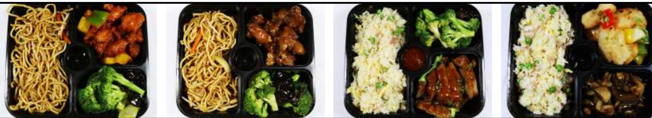
Mc5. Poulet aigre douce Mc6. Porc au caramel Mc7. Canard laqué Mc8. Poisson sel poivre