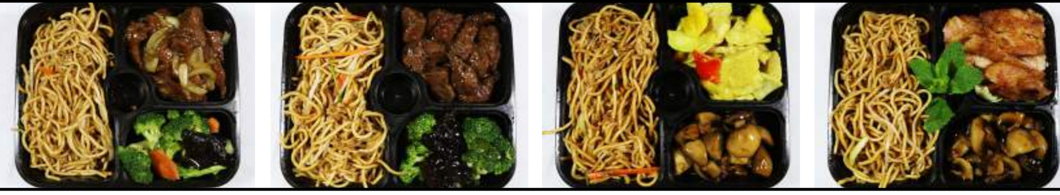
Mc1. Bœuf oignons Mc2. Bœuf poivre Mc3. Poulet curry Mc4. Poulet citronnelle

(exemple : Bœuf oignons + Riz blanc = Mc1 + B)