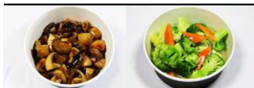
P12. Champignons P13. Brocolis champignons noirs