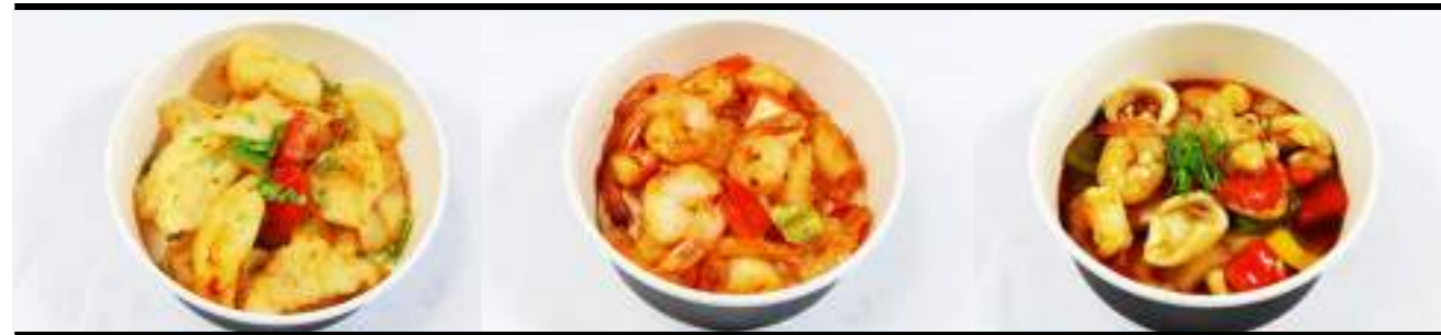
P9. Poisson sel poivre P10. Crevettes sauce piquante P11. Fruits de mer sauce Thai