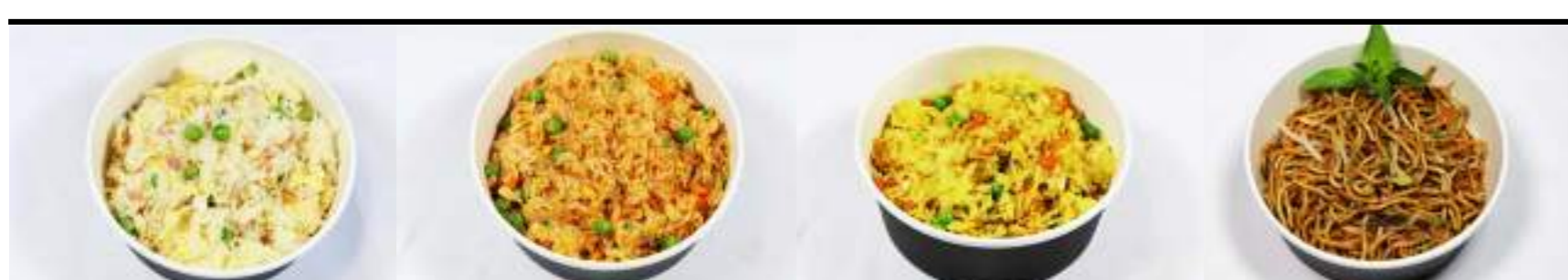
P15. Riz cantonais 4€ P16. Riz saté 4€ P17. Riz curry 4€ P18. Nouilles sautées soja 4€