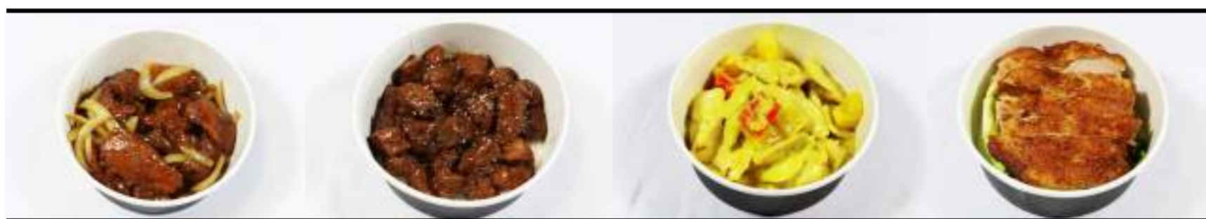
P1. Bœuf oignons P2. Bœuf poivre P3. Poulet curry P4. Poulet citronnelle