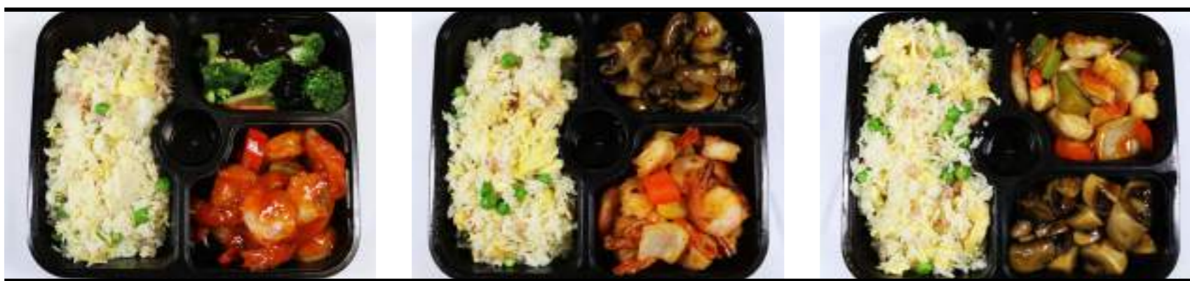
Mc9. Crevettes sauce piquante Mc10. Crevettes sel poivre Mc11. Fruits de mer sauce Thai